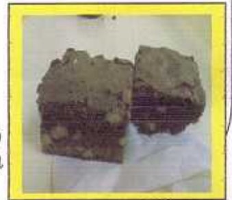
②ブラウニー (一個 178円) →

パン屋さんならではの、サクサクお菓子。サイコロ形のかわいい形に、ココアの味があとひきます。手間と愛情たっぷりのキュービックラスクです。