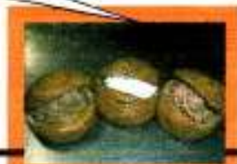
第2位:生チョコサンド